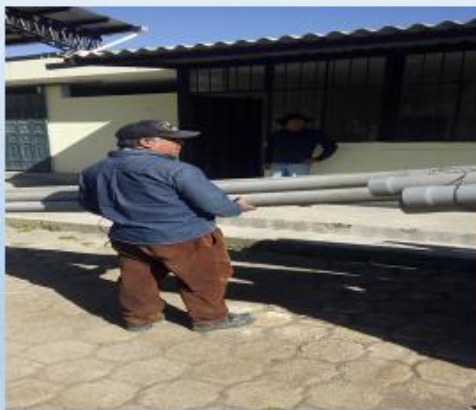
CONTROL DE MEDIDORES