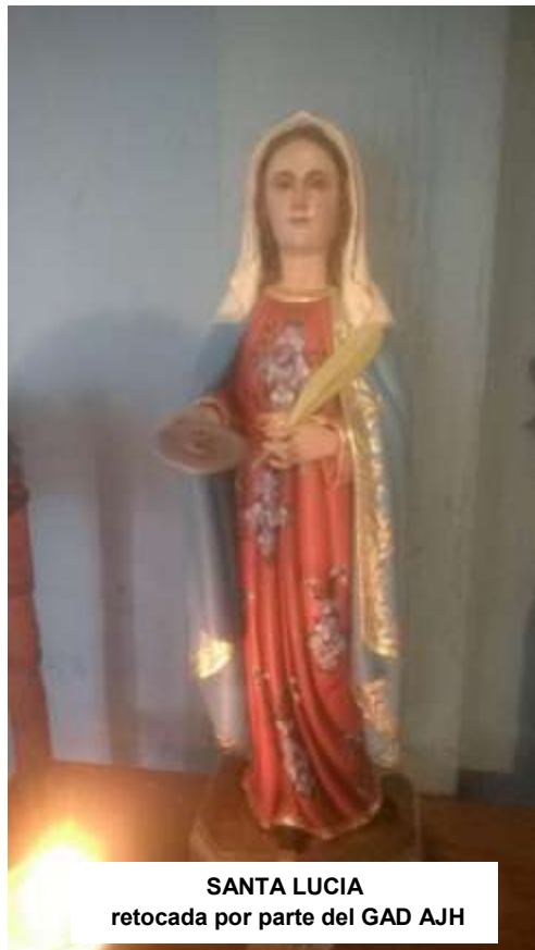
SANTA LUCIA retocada por parte del GAD AJH